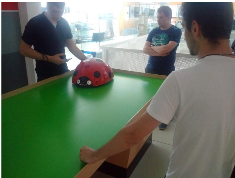
4. ábra A szegedi Katica