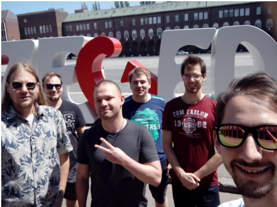
1. ábra A Szegedi Dómnál