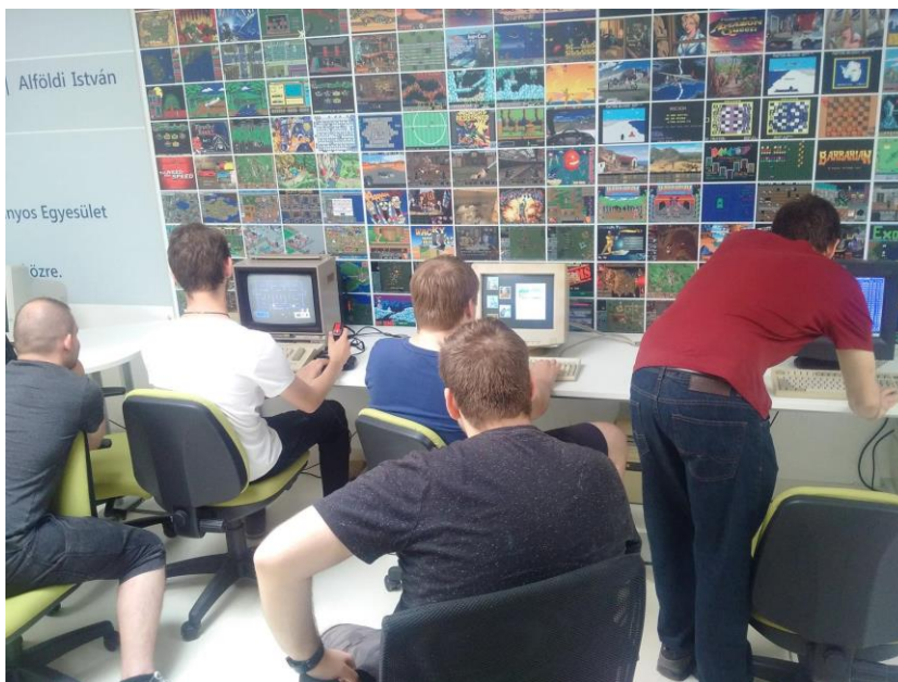
7. ábra Kipróbálható régi számítógépes játékok