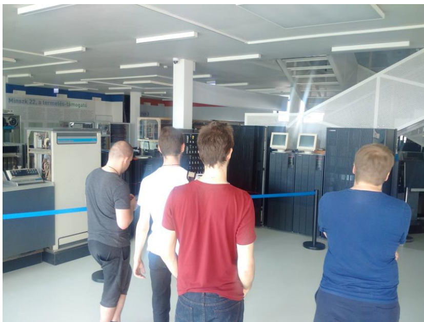
5. ábra Szerver számítógépek