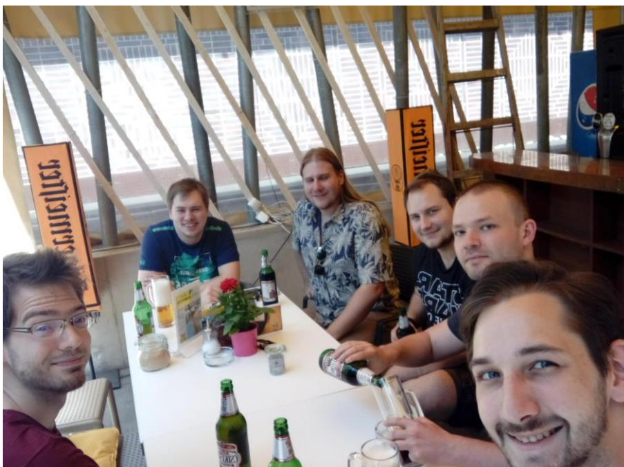
2. ábra Pihenő a városnézés közben