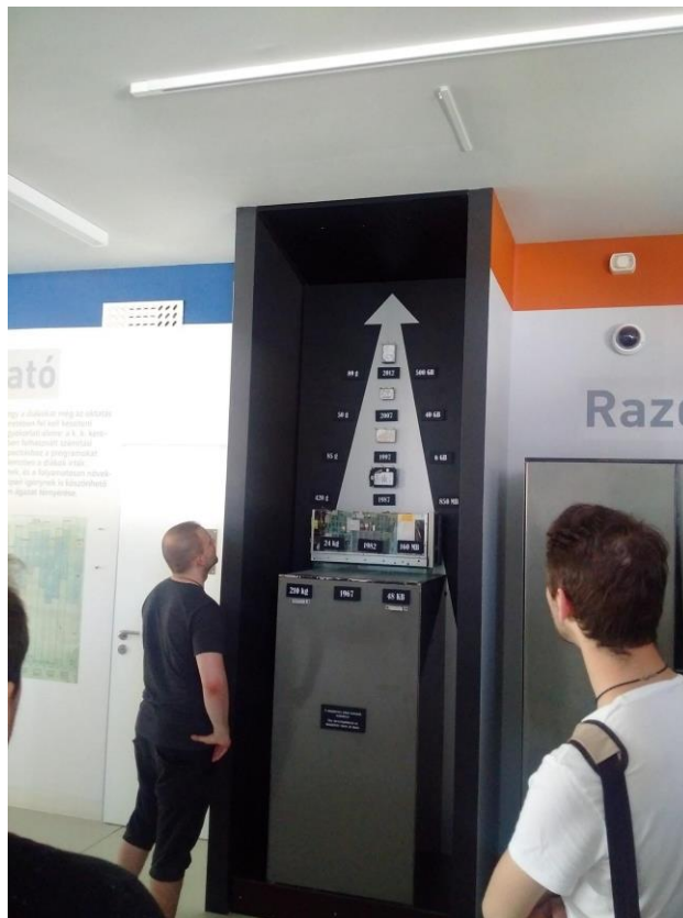
3. ábra A háttértárolók kapacitás-fejlődésének szemléltetése